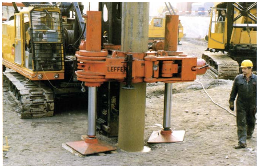
Spanschelle geschlossen Colier de serrage fermé Clamping collar closed